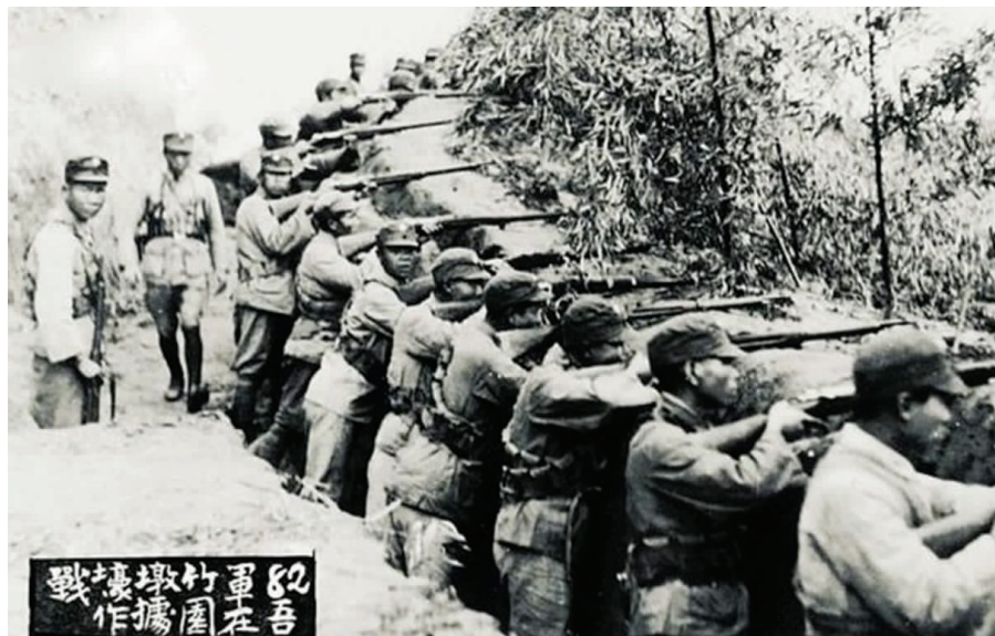
一·二八淞沪抗战中,十九路军在竹园墩战壕作战。

作为战略防御中心的江苏地区,抗战初期成为中国对日防御作战的重要战场之一。面对日军的进攻,中国军队奋起抗战,在江苏及周边地区相继组织了淞沪会战、南京保卫战和徐州会战等战役。期间,国民党军队的爱国官兵在抗日战场上付出了重大牺牲,并取得了台儿庄会战的胜利,给日军以沉重打击。但局部胜利没能阻止日军的侵略步伐,1937年12月13日,国民政府首都南京陷落。随后,江苏全境沦陷于日军铁蹄之下。