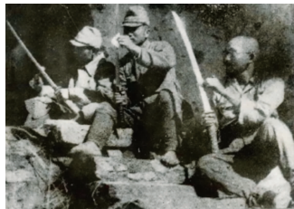
▲ 日军在屠杀竞赛后拭去屠刀上血迹