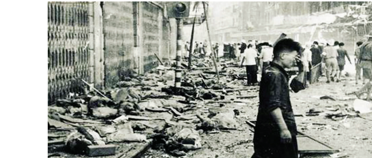
日军轰炸下的上海

日军在侵略江苏期间无数次地对机关、工厂、学校、医院以及道路、桥梁、名胜古迹等重要目标和民用设施展开狂轰滥炸,繁华都市处处焦土,企业大部分成为废墟,民族工业遭到严重摧残。南京、镇江、苏州、无锡、常州等繁华商埠均遭受日军野蛮破坏,商业街普遍遭到狂轰滥炸,商铺货物大量被毁。仅南京市临时参议会于1946年公布的一个文件中引用的第13次《南京抗战损失调查》就表明,损失财物估计达国币2300多亿元,其中高丽华房屋784幢又31000间。苏州工业损失218150300元,仅苏纶纱厂直接损失就达2398300元;无锡县的企业有28537间厂房毁于战火;常州工业损失218921000元。