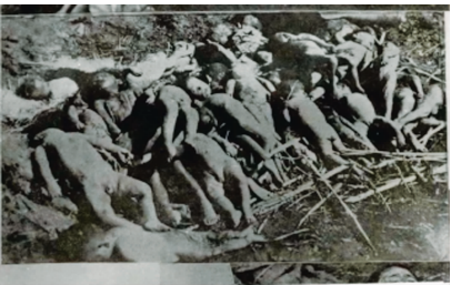
被日军残杀的儿童

1937年12月,日军制造了第二次世界大战史上“三大惨案”之一的南京大屠杀,留下了人类文