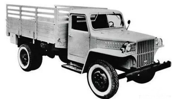
第一辆130型帆布载货汽车

1958年3月10日凌晨5点,第一辆NJ130型2.5吨载重汽车缓缓驶出南京汽车修配厂的厂房。