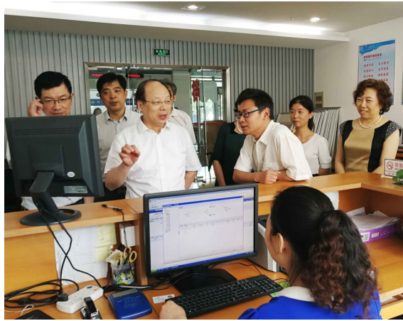
调研无锡滨湖区档案局

6月5日至7日,江苏省档案局党组书记、局长陈向阳在苏州、无锡两地调研时强调,全省各级档案部门要深入学习贯彻习近平总书记在浙江工作期间到浙江省档案局调研时的重要讲话精神,深入学习贯彻中共中央政治局委员、中央书记处书记、中央办公厅主任薛祥今年年初在中央档案馆国家档案局调研和省委书记姜向东4月3日在南京调研时的讲话精神,扎实开展“推动思想解放,促进全省档案事业高标准高质量发展大讨论”,以习近平新时代中国特色社会主义思想 and the 19th National Congress Spirit as the guide, to promote the development of the archive work in the new era.