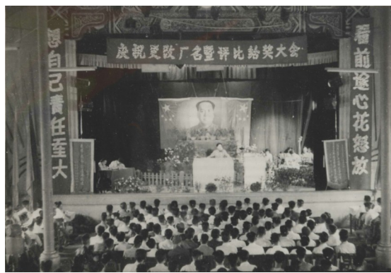
1958年6月,庆祝更改厂名大会。

南京汽车修配厂确定了“以制造发动机为主与专业厂相结合,采取广泛协作,组织汽车生产”的方针,从研究仿制070型发动机入手,在一机部汽车工业支持下广泛协作,组织配套生产。只用了短短半年时间,1958年3月10日,第一辆NJ130型2.5吨载重汽车试制成功,经一机部命名为“跃进牌”,这是继长春第一汽车制造厂解放牌汽车问世以后我国第二种牌号的载重汽车。6月10日,一机部正式批准厂名为“南京汽车制造厂”。