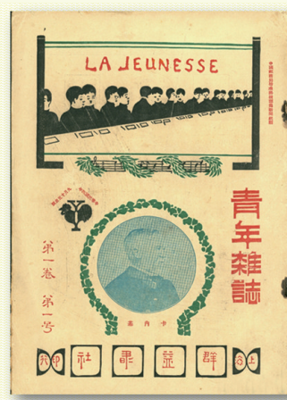
《青年杂志》创刊号(1915年)

真理就是马克思主义及其中国化的理论成果,理想就是实现共产主义远大理想和中国特色社会主义共同理想。没有革命的理论,就不会有革命的运动。1917年俄国十月革命的胜利给东方被压迫民族以巨大鼓舞。中国一批先进分子开始选择马克思主义。从陈独秀1915年在上海创办《青年杂志》到五四运动后,传播马克思主义的文章、图书大量出现。1918年,中国第一个传播马克思主义并主张向俄国十月革命学习的先进分子李大钊,在《新青年》发表《庶民的胜利》《Bolshevism的胜利》,他预言十月革命所掀起的潮流不可阻挡,说:“试看将来的环球,必是赤旗的世界!”1920年11月,在陈独秀的主持下,上海的共产党早期组织拟定了《中国共产党宣言》,指出“共产党者的目的是要按照共产主义的理想,创造一个新的社会”。1921年7月中国共产党一经成立,就旗帜鲜明地把社会主义和共产主义规定为自己的奋斗目标,坚持以马克思主义为行动指南。1925年11月21日,毛泽东填写的《少年中国学会改组委员会调查表》,面对“对于目前内忧外患交迫的中国究抱何种主义”的问题,他写下,“本人信仰共产主义,主张无产阶级的社会革命”。1936年10月,毛泽东与美国记者斯诺谈到他自己1920年春天在北