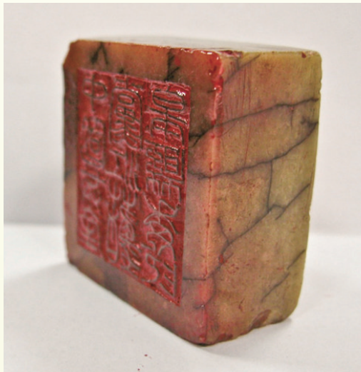
1927年中国共产党江苏如皋县委印章(如皋市档案馆藏)

“为有牺牲多壮志,敢教日月换新天”是共产党人甘于奉献、不懈奋斗的大无畏精神,是共产党人政治本色的重要内涵,是共产党人为国为民的慷慨情怀,是共产党人对“初心”的最高诠释。江苏省委首任书记陈延年和江苏省委组织部部长陈乔年两兄弟、两先烈,他们在赴法勤工俭学时,就将马克思主义作为信仰,直至牺牲一刻。面对敌人屠刀,陈延年回答:“革命者只有站着死,绝不跪!”在就义时刻,陈延年几次被刽子手强行按下头颅,但他坚强不屈,几次昂起头颅,刽子手无可奈何、恼羞成怒,最后竟将陈延年乱刀砍死。面对狱中酷刑,陈乔年说:“让我们的子孙后代享受前人披荆斩棘的幸福吧!”江苏省委代理书记赵世炎,是中国共产党早期杰出的无产阶级革命家、著名的工人运动领袖,1927年7月2日不幸被捕,面对敌人的屠刀,他慷慨激昂地表示:“志士不耻牺牲,共产党必将取得胜利!”这些优秀的共产党员对革命事业的耿耿忠心,跃然纸上;他们对亲人的关怀牵挂,感人至深;他们留下的铁血忠言语,永远闪耀着夺目的光彩。江苏省委成立7年半时间,遭到敌人反复破坏,重建、改组达16次之多,省委书记陈延年、赵世炎、许包野以及省委常委郭伯和、陈乔年、彭湃、黄励等同志先后牺牲,南京雨花台作为新民主主义革命时期中国共产党人和爱国志士最集中的殉难地,凝结成共产党人“两高一”的雨花英烈精神。刚被评为国家一级革命文物的1927年中共如皋县委印章,见证了从1929年1月27日至1933年4月28日,在短短的四年多时间里,如皋接二连三8位县委书记。革命先驱们真正用行动诠释了“为有牺牲多壮志”的壮怀激烈。回顾红色档案中党在江苏的百年党史,我们能深刻认识到“不怕牺牲、英勇斗争”的伟大精神贯穿于革命、建设、改革各个时期,看到了共产党人不怕斗争、敢于斗争,在斗争中砥砺前行,成长壮大的红色基因,深切体会到我们党永葆生机活力的核心密码。