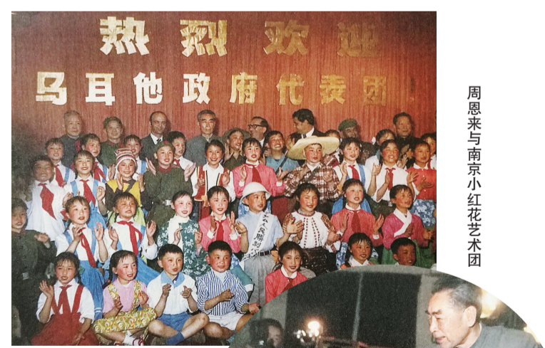
周恩来与南京小红花艺术团

装不同。举着火炬穿工装的那个小演员是中国人,为什么人群中还有一个穿西藏民族服装的小演员?别的国家一个代表,中国有两个代表,这样不合适,要防止大国沙文主义嘛!