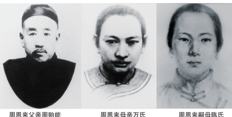
周恩来父亲周贻能

陈氏出身于书香门第,喜欢读书、画画、写诗,有较深的文学修养,是一个富有才学的聪明女子。当大鸾还牙牙学语时,她便将一些比较通俗的唐诗片断当儿歌教给大鸾。大鸾虽然年幼,却非常聪明,一教就会,很小时候就能背诵很多唐宋名家的诗句了,五岁时就开始识字,练习写毛笔字。为了把字写得好,他常常站在书桌前,悬肘握笔,勤学苦练。陈氏对周恩来十分爱护,把全部心血都倾注在对他的抚养和教育上,不仅教他识字、背诵,还经常给他讲述家乡历史——历史名将梁红玉、关天培和文化名人吴承恩、吴敬梓、汪廷珍等人的爱国爱民、反贪抗暴、清正廉洁、潜心治学的事迹和故事。在保存下来的周恩来的两篇早期作文《射阳回忆》《巾帼英雄》中,就记述了他对有关两淮人物的认识和感受。四十年后,周恩来曾动情地说:“直到今天,我还得感谢母亲的启发,没有她的爱护,我不会走上好学的道路。”