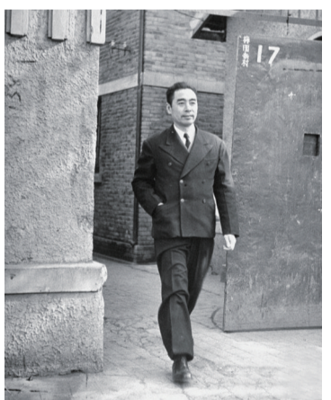
行走在南京梅园新村17号的周恩来,目光炯炯,神采奕奕,充满了革命必胜的信心。

抗日战争胜利后,国民政府还都南京。为粉碎国民党的内战阴谋,争取国家的持久和平,周恩来肩负中国共产党和全国人民的神圣使命,率领中共代表团来到南京,继续与国民党政府进行针锋相对的谈判斗争。