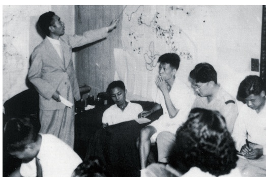
1946年11月16日,周恩来在南京举行中外记者招待会。