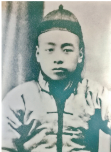
周恩来的童年留影,清秀俊朗中透着聪颖、果敢和坚毅。

运河水滔滔,澎湃世世代代,驹马巷悠悠,走来治世英才。江苏淮安,是苏北大平原上的一座历史文化名城。它地处我国第四大淡水湖——洪泽湖畔,这里又是京杭大运河和千里淮河的交汇之地,交通便捷带来市面繁荣、文化发达。