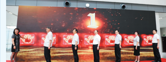
“建党百年 初心如磐——长三角红色档案珍品展”江苏6+1联展开展启动仪式

2020年3月，江苏公共新闻频道《黄金时间—改革政策e解读》节目，推出“让档案活起来、亮起来”，通过政策解读，让老百姓走进档案、了解档案、利用档案。