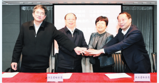
三省一市签署《长三角地区开展民生档案“异地查档、便民服务”工作合作协议》

2018年3月，上海市档案局(馆)牵头与苏浙皖三省档案部门共同签订了《长三角地区开展民生档案“异地查档、便民服务”工作合作协议》，三省一市档案部门共同破除壁垒，使百姓可在区域范围内任何一家国家综合档案馆跨地域、跨馆际查阅利用馆藏民生档案。