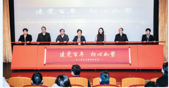
“建党百年 初心如磐——长三角红色档案珍品展”开幕仪式

2019年8月，上海市档案局(馆)举办的“真理之甘，信仰之源——纪念陈望道首译《共产党宣言》中文全译本100周年主题展”在浙江省义乌市和绍兴市上虞区开始巡展。